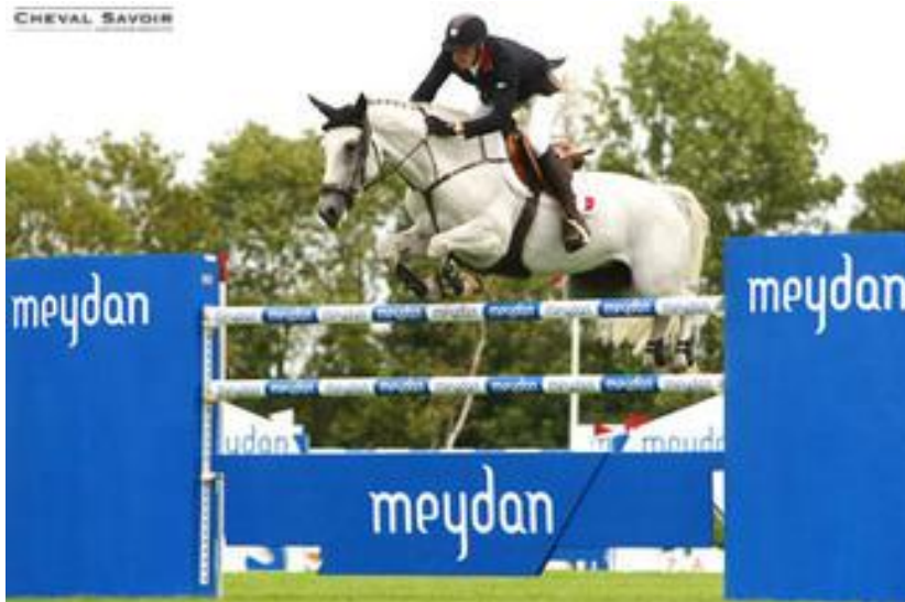
Kevin Staut avec Sultana réalise le meilleur score de l'équipe.